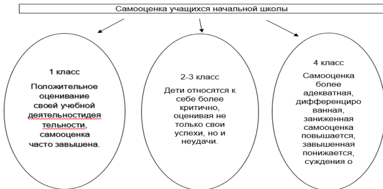
Рисунок 1 – Самооценка учащихся начальной школы

Схематично самооценка учащихся начальных классов представлена на рисунке 1.