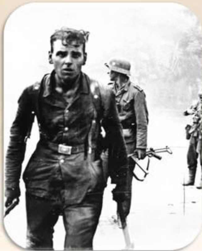
Немецкие солдаты в уличном бою в Новороссийске